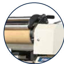
중량물원단 전용 원단풀림시스템 Exclusive fabric pulling system for heavy fabrics.