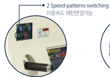
수동동작 제어부 Manual control