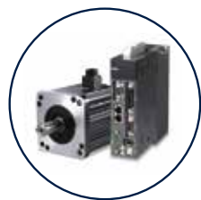
서보모터&디지털 장력제어 Servo motor & Digital tension control